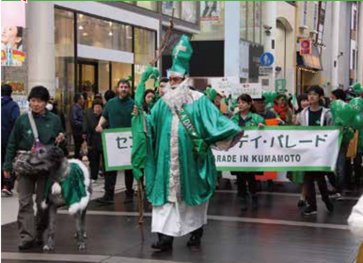
▲昨年のパレードの様子